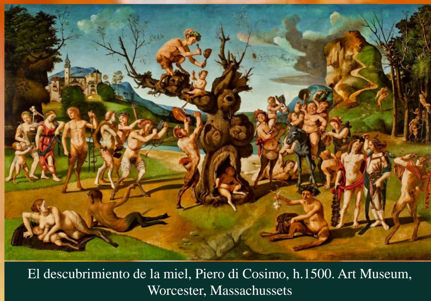
El descubrimiento de la miel, Piero di Cosimo, h.1500. Art Museum, Worcester, Massachusetts