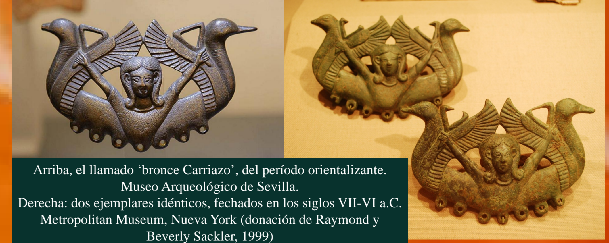
Arriba, el llamado "bronce Carriazo", del período orientalizante. Museo Arqueológico de Sevilla. Derecha: dos ejemplares idénticos, fechados en los siglos VII-VI a.C. Metropolitan Museum, Nueva York (donación de Raymond y Beverly Sackler, 1999)

A partir del análisis del tema representado, parece claro que el origen del mismo se halla en el Levante mediterráneo, en paralelo a otros materiales propios del período orientalizante, cuya característica principal es, precisamente, el eclecticismo con el que reúne aspectos e influencias del mundo egipcio, fenicio, oriental y griego, tal como ya definiera Antonio Blanco hace algo más de seis décadas