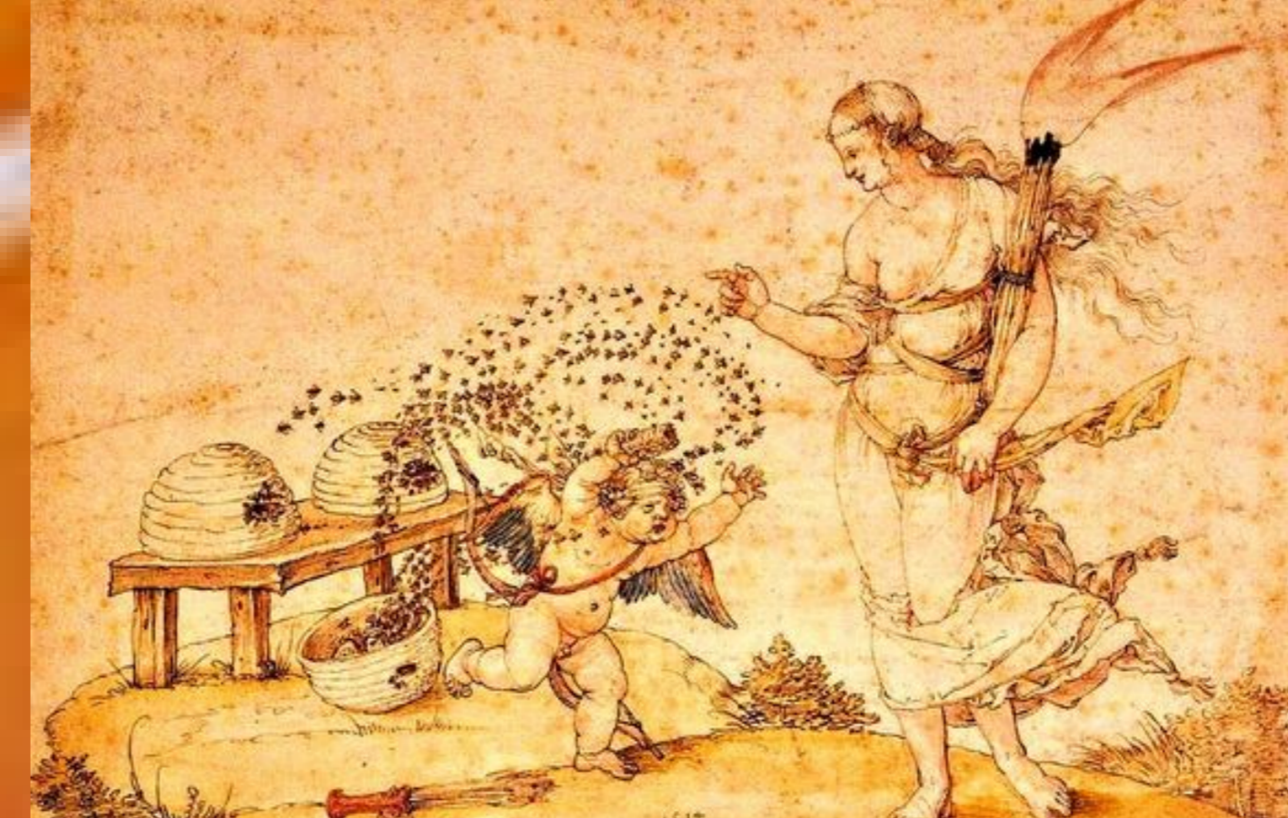
El castigo de Cupido , Alberto Durero, 1514. Kunsthistorisches Museum, Viena