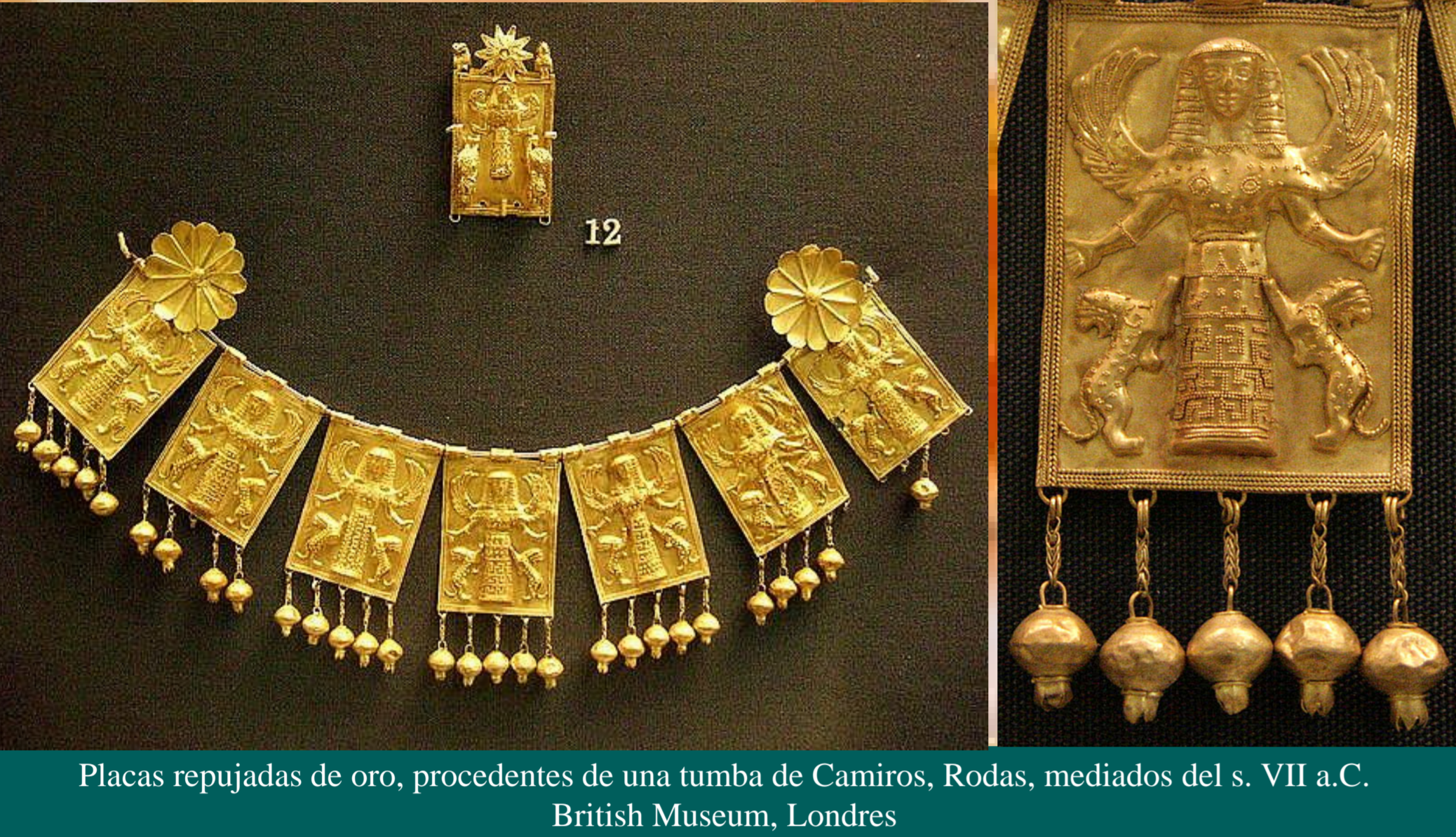
Placas repujadas de oro, procedentes de una tumba de Camiros, Rodas, mediados del s. VII a.C. British Museum, Londres