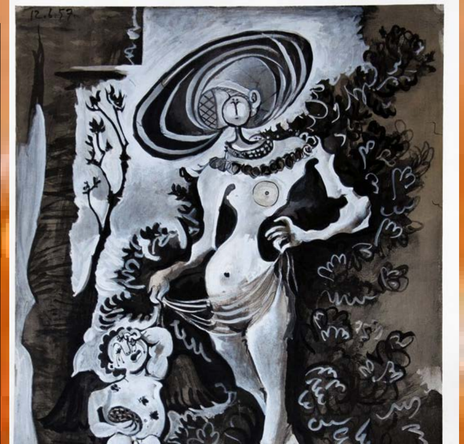
Vénus et l'Amour de miel , P. Picasso, 1957, litografía en color sobre papel. Lehman Collection, Metropolitan Museum of Art, Nueva York