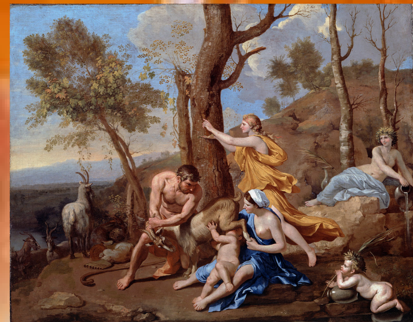
Melissa recoge la miel y su hermana Adrastea da de mamar a Zeus la leche de la cabra Amaltea, según Nicolás Poussin (1594-1665). Izda.: La infancia de Júpiter , h. 1635. Dulwich Picture Gallery, Londres. Dcha.: 1639-1640. Gemäldegalerie, Berlín