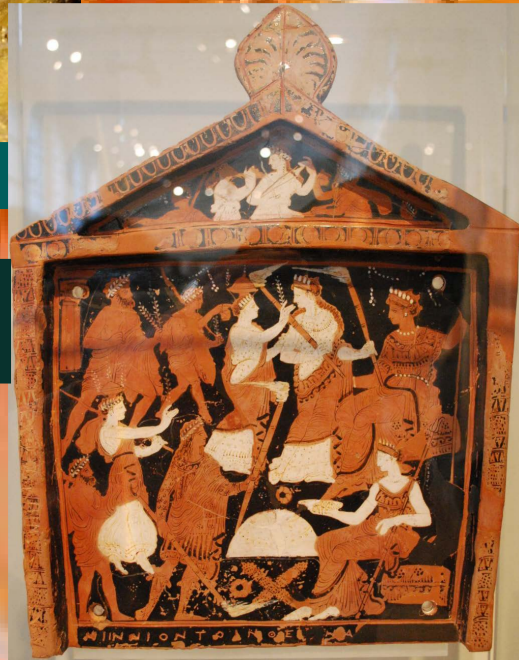
Pínox o placa pintada de figuras rojas, ofrecida por Ninnion a Deméter en Eleusis, 350-300 a.C. Museo Arqueológico Nacional, Atenas