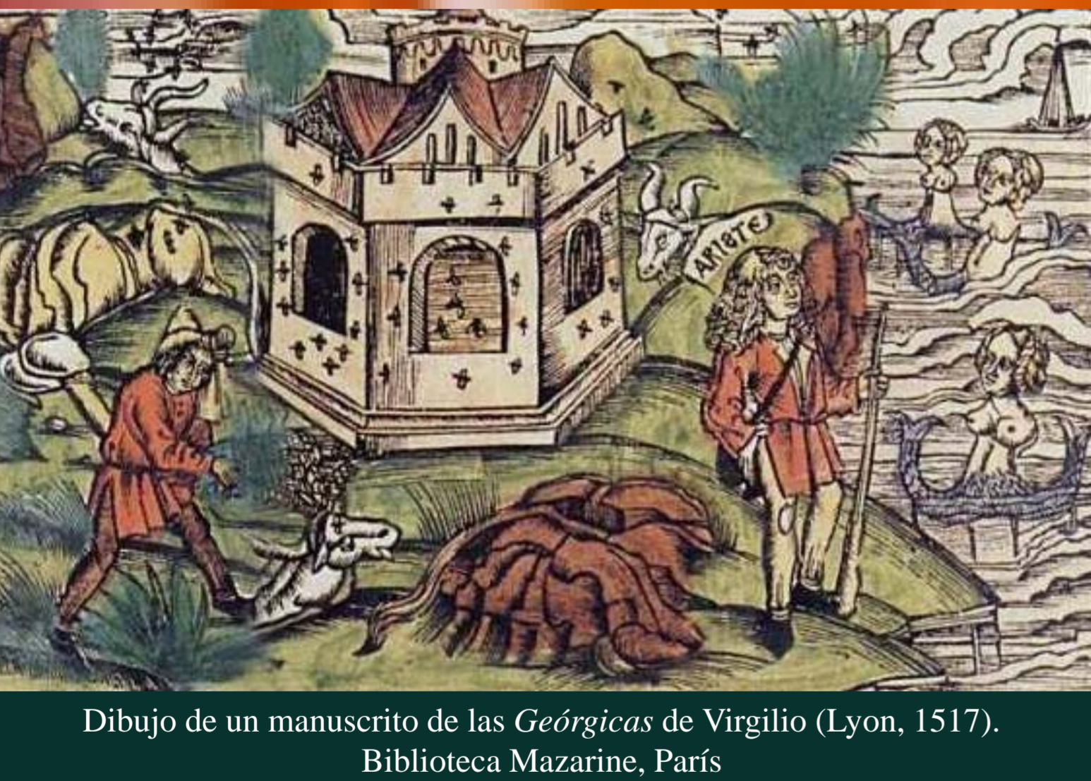
Dibujo de un manuscrito de las Geórgicas de Virgilio (Lyon, 1517). Bibliothèque Mazarine, París