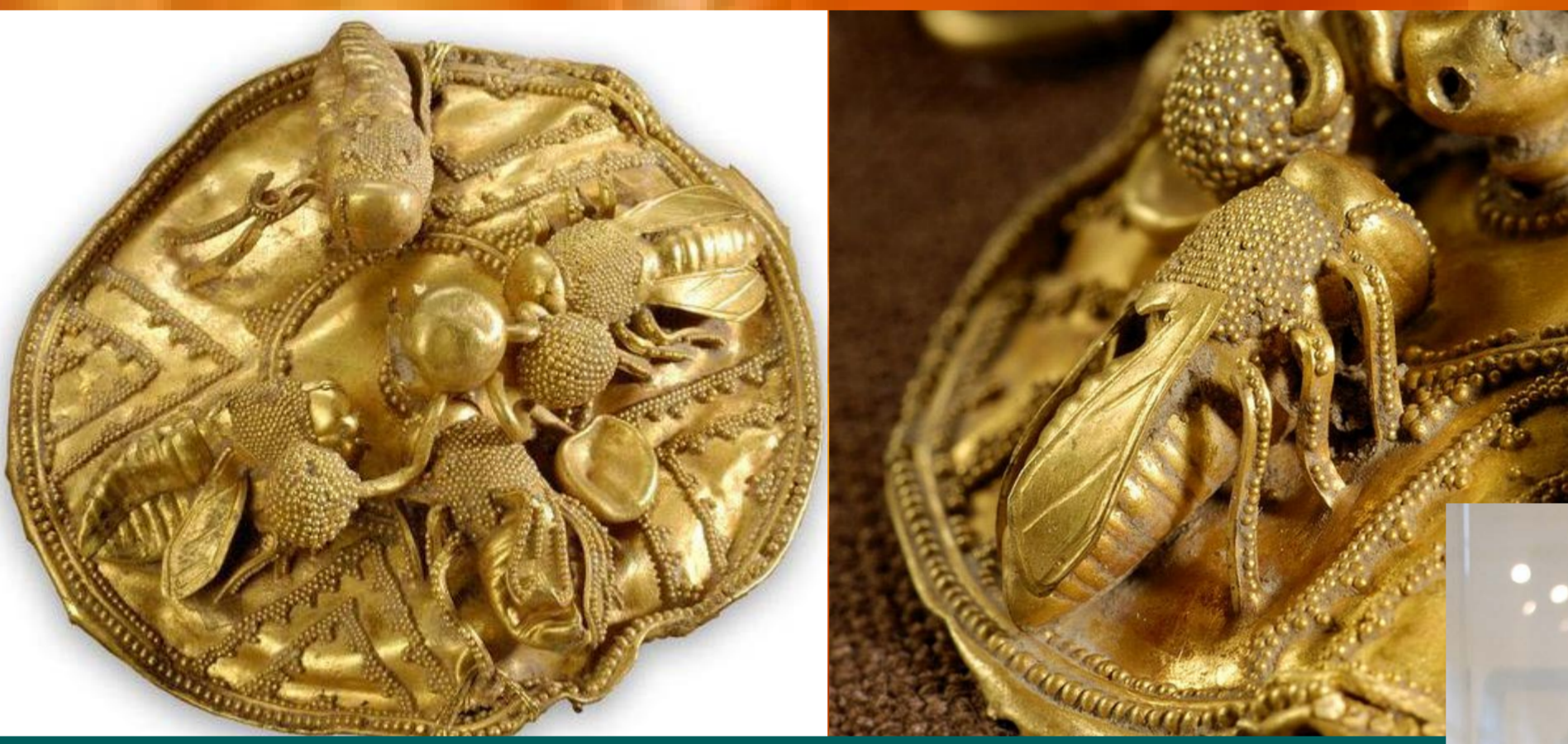
Grupo de abejas en un adorno discoidal procedente de Jonia, s. VII a.C. Nasher Museum of Art at Duke University, Durham, Carolina del Norte