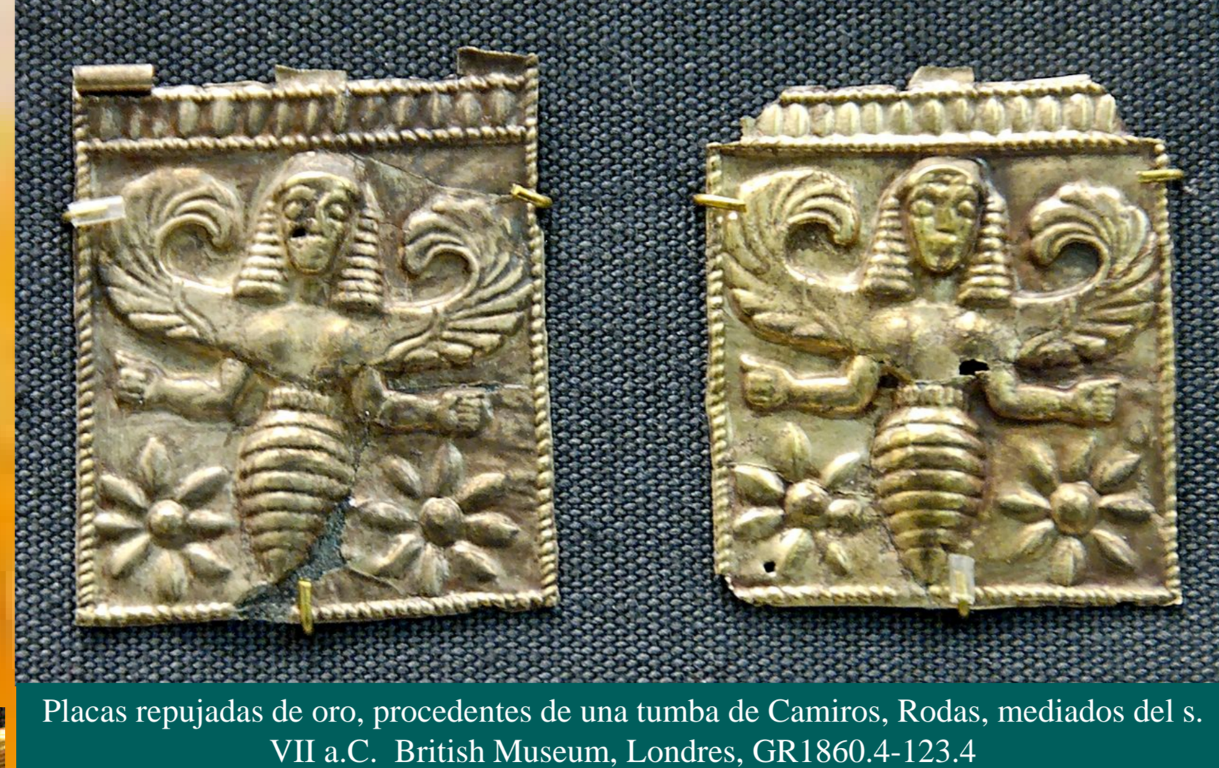
Placas repujadas de oro, procedentes de una tumba de Camiros, Rodas, mediados del s. VII a.C. British Museum, Londres, GR1860.4-123.4