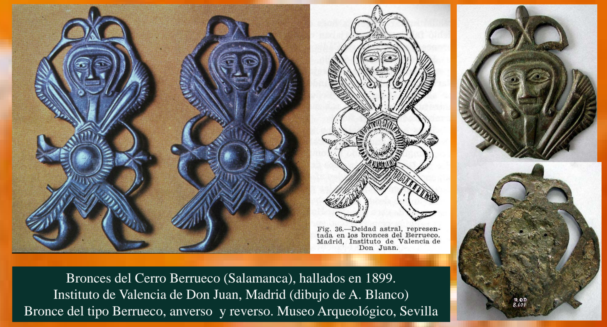
Bronces del Cerro Berrueco (Salamanca), hallados en 1899. Instituto de Valencia de Don Juan, Madrid (dibujo de A. Blanco) Bronce del tipo Berrueco, anverso y reverso. Museo Arqueológico, Sevilla