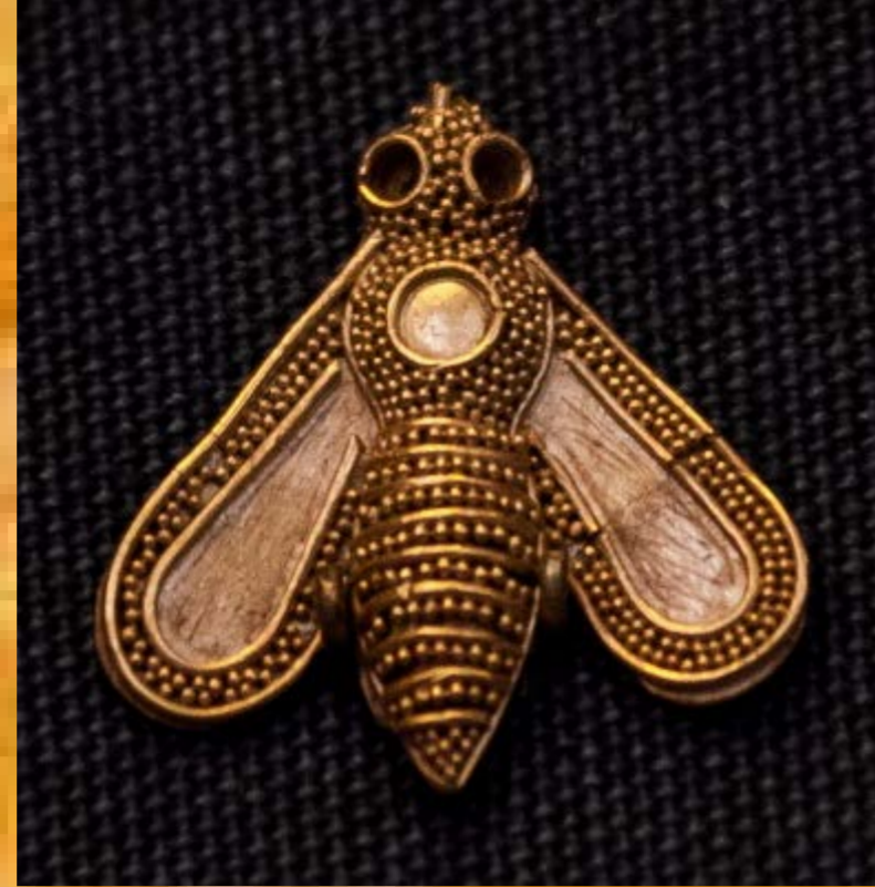
Colgante de origen desconocido, de época minoica (¿Creta?). British Museum, Londres, GB IMG 6443