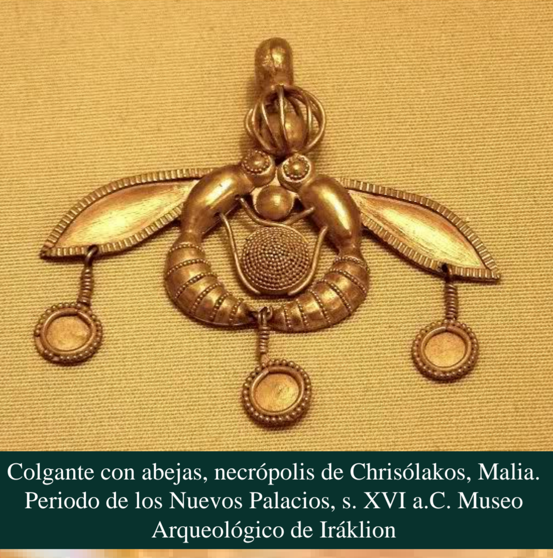
Colgante con abejas, necrópolis de Chrisólakos, Malia. Periodo de los Nuevos Palacios, s. XVI a.C. Museo Arqueológico de Iráklion