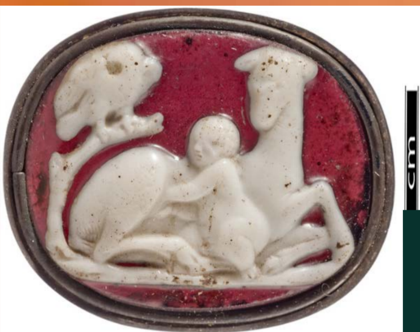
Zeus, Amaltea y águila, camafeo de época imperial. Bibliothèque nationale de France, París