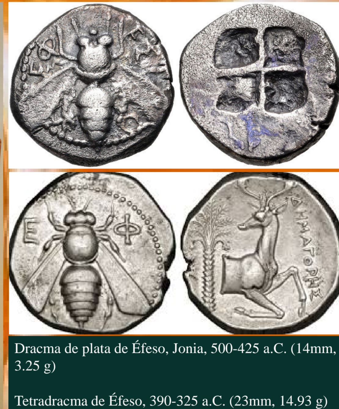
Draagma de plata de Éfeso, Jonia, 500-425 a.C. (14mm, 3.25 g)